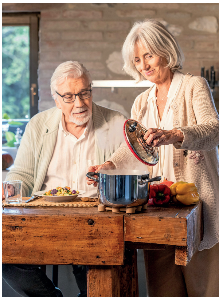
Imatge de Md Ishak Raman per unsplash

Un altre exemple especialment suggeridor és el projecte Salsa, impulsat com a pilot per connectar atenció sanitària, atenció social i restauració local. La proposta consisteix a detectar persones en situació de soledat no volguda i prescriure'ls, des del sistema d'atenció primària i els serveis socials, dinars setmanals en un restaurant del poble amb menús treballats des del punt de vista nutricional. L'interès del projecte no és només alimentari. El que posa en joc és una idea més profunda: compartir un àpat en un entorn comunitari pot esdevenir una intervenció de salut. Aquest pilot va mostrar millores en indicadors vinculats a l'estat emocional. Més enllà de la magnitud concreta dels resultats, el missatge és potent: alimentar-se bé i socialitzar no són dues polítiques separades. En la vellesa, sovint formen part de la mateixa estratègia preventiva.